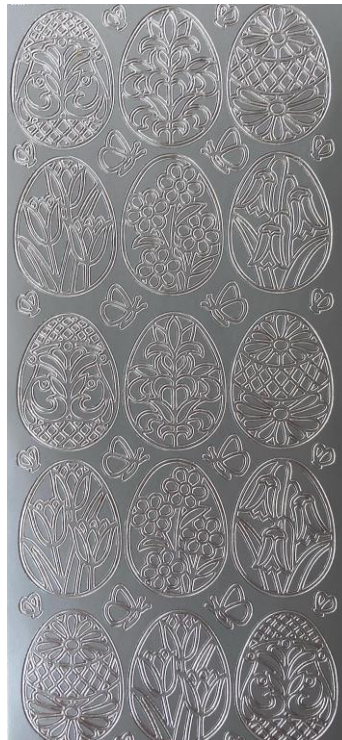
11 Ostereier je ca. 4cm