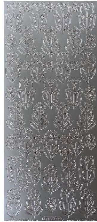
12 Blumen je ca. 3cm