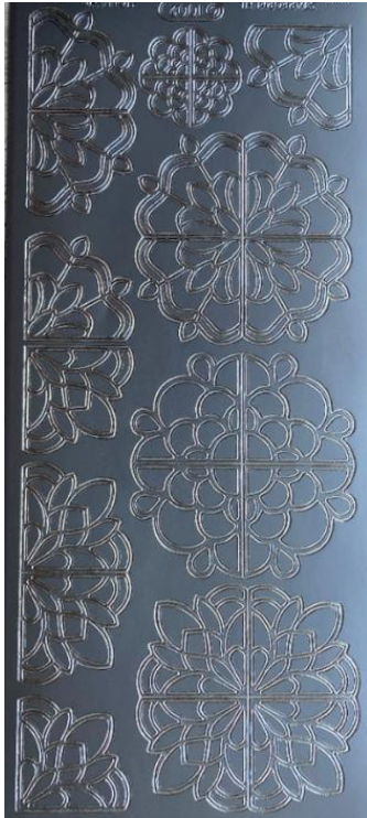
19 Ornamente 1