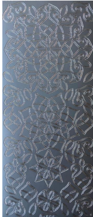
20 Ornamente 2