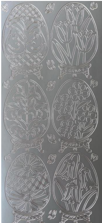
10 Ostereier je ca. 6cm