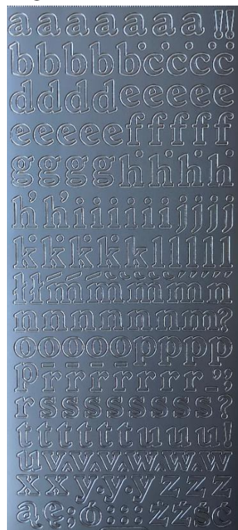
17 Buchstaben klein