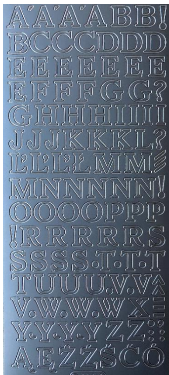
16 Buchstaben groß