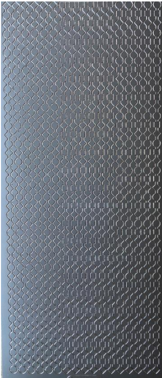
13 Bordüre 1